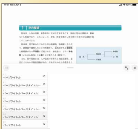
※画像は開発中のものにつき、実際の仕様とは異なる場合がございます。