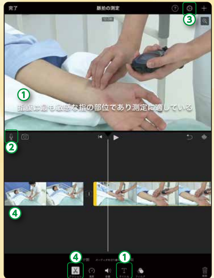
画像は、ナーシング・グラフィカ基礎看護学動画「脈拍の測定」です